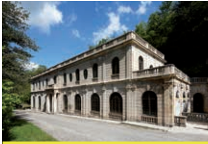
Auberge des Dauphins (Saoû)

dans les lacets du dernier kilomètre. La descente vers Aouste est très belle, avec notamment le ruisseau et le Pas de Lauzens, échancrure s'ouvrant sur la vallée de la Drôme. À peine arrivé en bas, il faut remonter en direction de La Répara, par une petite route qui serpente dans les coteaux secs. Un arrêt au hameau des Lombards est alors conseillé avant de s'attaquer à la dernière petite difficulté, la montée du petit col de Lunel. D'ici, il suffit de se laisser descendre dans la vallée du Roubion.